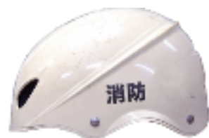
弊社での貼り付けは行っておりません